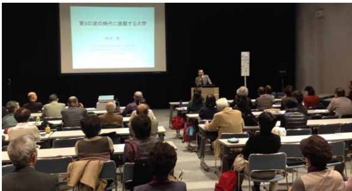
TSS 文化大学で講演する筆者

本日の講義題目「第 3 の波の時代に挑戦する大学」は、第3の波の時代とは何か、第3の波の時代に挑戦する大学、挑戦する大学の方向性、の3部構成になっております。