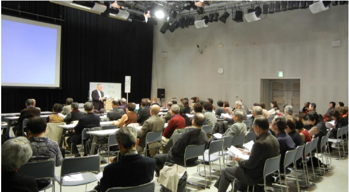
TSS 文化大学で講演中の著者