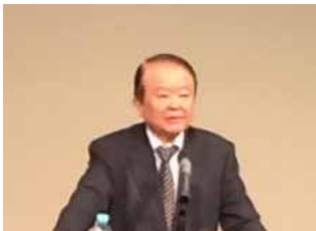
TSS 文化大学で講演する著者

その中で衝撃的であったことは、日本の人口の将来推計を各市区町村毎に分析し、現状のまま推移すると、全国の約半数の 896 (うち広島県は 12) 市区町村が消滅の可能性 (2010 年~40 年までの間に 20~39 歳の女性 ((生まれる子の 95%がこの年齢層)) 人口が 50%以下に減少する市区町村数) があると警鐘を鳴らしたことである。とりわけ消滅可能性の対象となった市区町村を中心として全国に波紋が広がったのである。