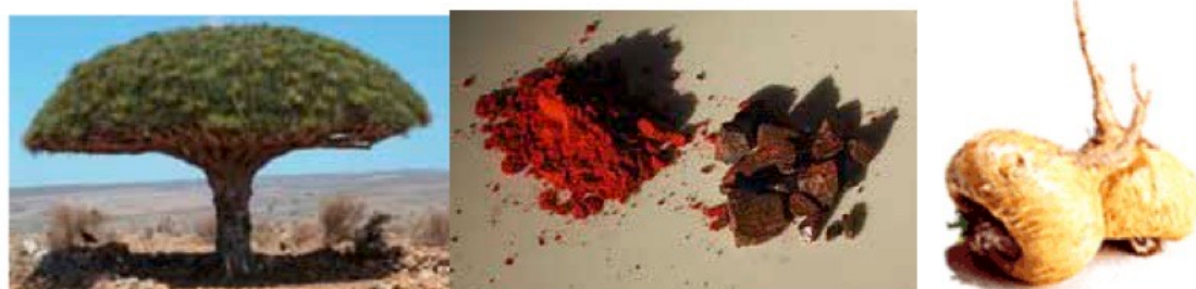
Dragon's Blood の樹と樹液の乾燥品