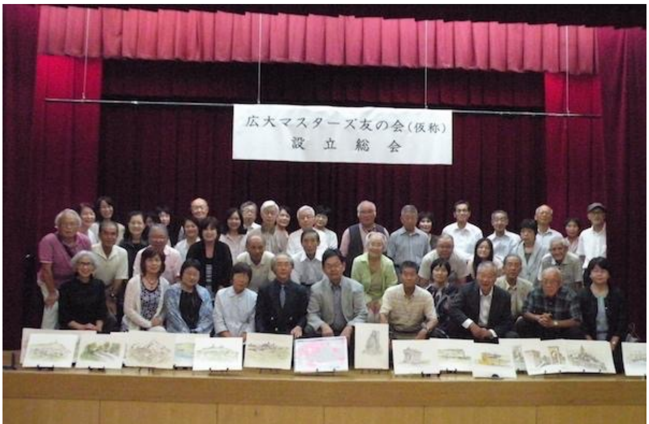
一連の行事の最後には参加者全員で記念撮影を行いました。