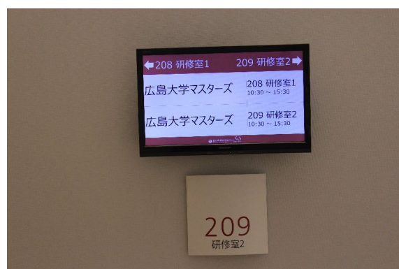
芸術文化ホールくらはら2階会議室にて開催