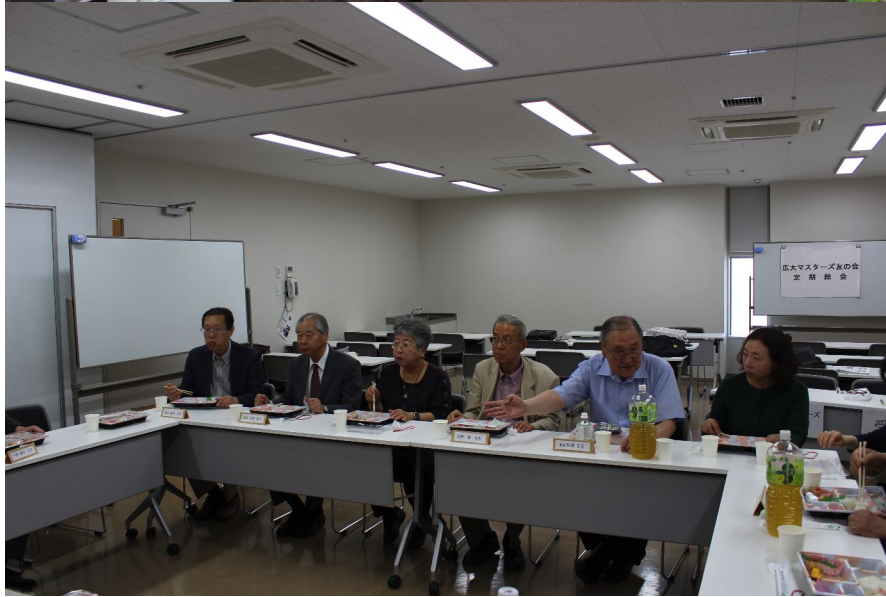
懇親昼食会 マスターズ会員と友の会会員が相互に車座となり、様々な話題が飛び交い和やかに交流を図ることができました