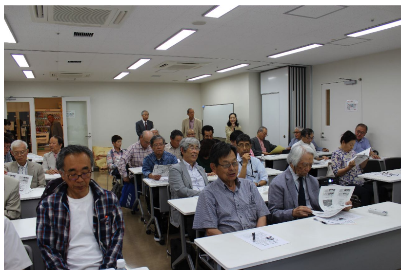
講演会に引き続き活発な質疑と応答が行われました